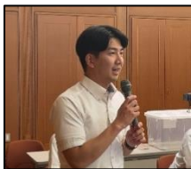
【学習会で質問をする青年部員】