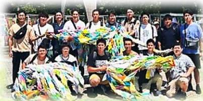
【折り鶴を捧げる青年部員】 (写真は昨年度のもの)

8月5・6日に青年部の代表が、折り鶴を『原爆の子の像』に捧げてきます。また、学習会として、被爆体験者の講話を聞き、平和意識を高めます。