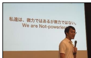
【平和教育学習会の様子】